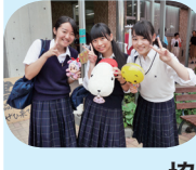
協力大学(敬称略) 筑波大学 群馬大学 早稲田大学

「音楽には、その時その瞬間の映像や思いを蘇らせる力がある。」演奏会を終えて、顧問の先生の言葉の意味がやっと理解できました。時には辛かったこともありましたが、目標に向かって一緒に努力することの素晴らしさを感じることができました。これまで私たちに携わってくださった多くの方々へ心より感謝申し上げます。