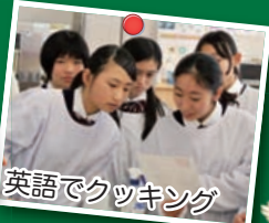
英語でクッキング